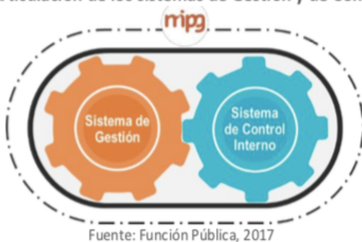
Gráfico 1. Articulación de los sistemas de Gestión y de Control Interno

El Modelo Integrado de Planeación y Gestión, surge para las entidades de la rama ejecutiva del poder público mediante el Decreto 1083 de 2015, modificado posteriormente mediante el Decreto Presidencial 1499 de 2017, donde surge la integración entre el Sistema de Gestión de Calidad con el Sistema de Desarrollo Administrativo en un único Sistema de Gestión y su articulación con el Sistema de Control Interno .