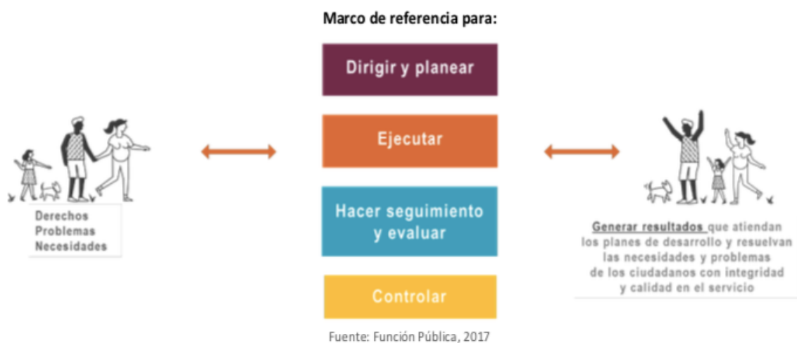
Gráfico 2. Definición del Modelo Integrado de Planeación y Gestión –MIPG

Estas disposiciones se enmarcan en el Decreto Departamental 0756 de 2018 “Por medio del cual se estructura el sistema de gestión, se adopta el Modelo Integrado de Planeación y Gestión (MIPG) del Departamento de Risaralda – Administración Central y se Deroga el Decreto 0874 de 2017.”