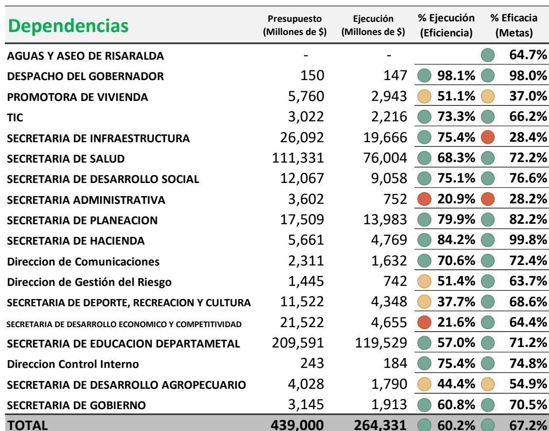
Tabla 2 Gobernación de Risaralda, Informe de % Eficiencia (Ejecución presupuestal) y % Eficacia (Cumplimiento de Metas), Según Dependencias, Cuarto Bimestre 2019

Fuente: Secretaría de Planeación, Sistema de seguimiento Plan de Desarrollo